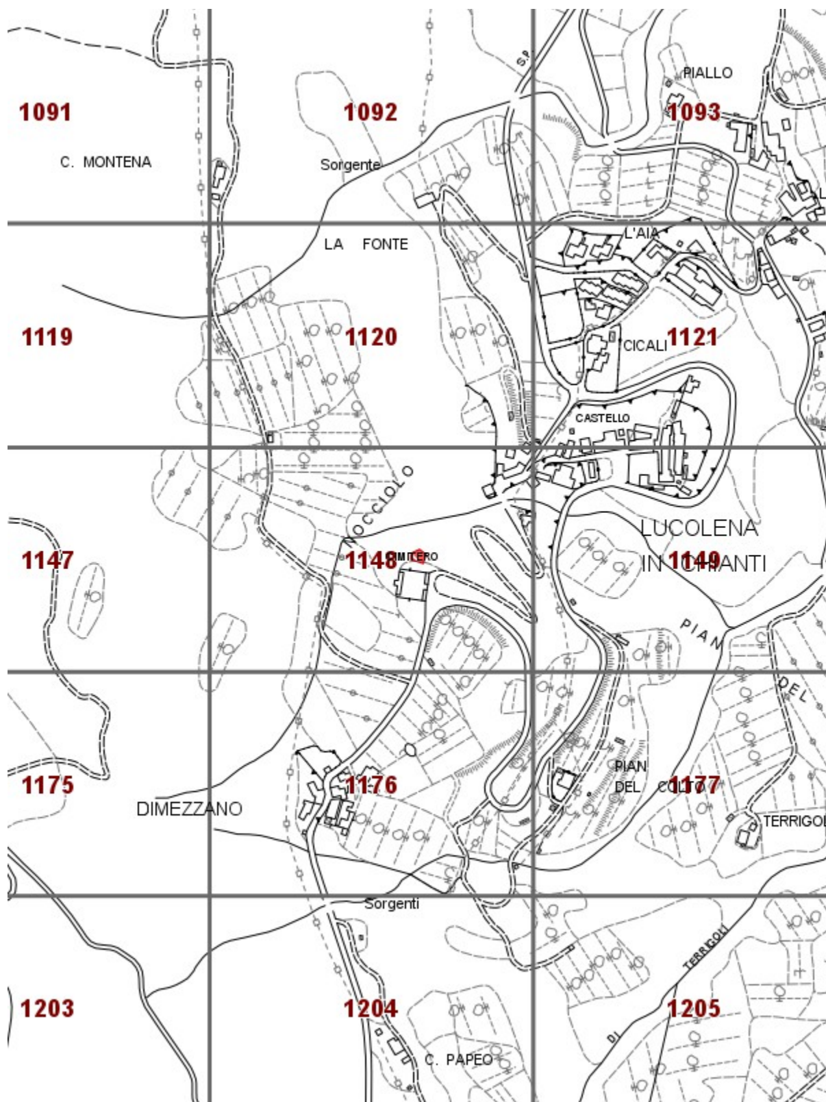
Fascicolo territoriale n. 1 - 2014 Inquadramento generale - Scala 1:10000