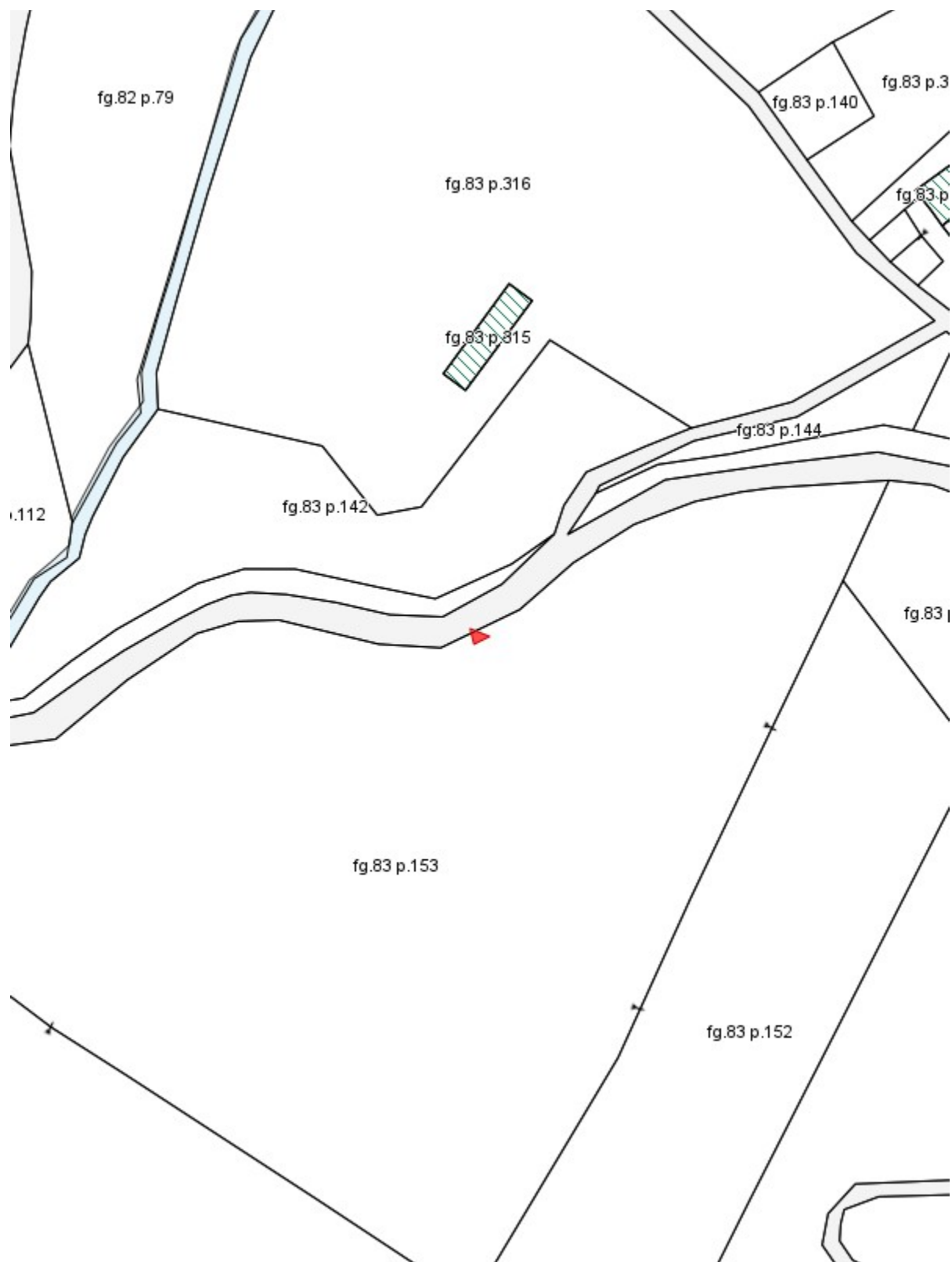
Fascicolo territoriale n. 7 - 2017 Inquadramento su Catasto - Scala 1:2000